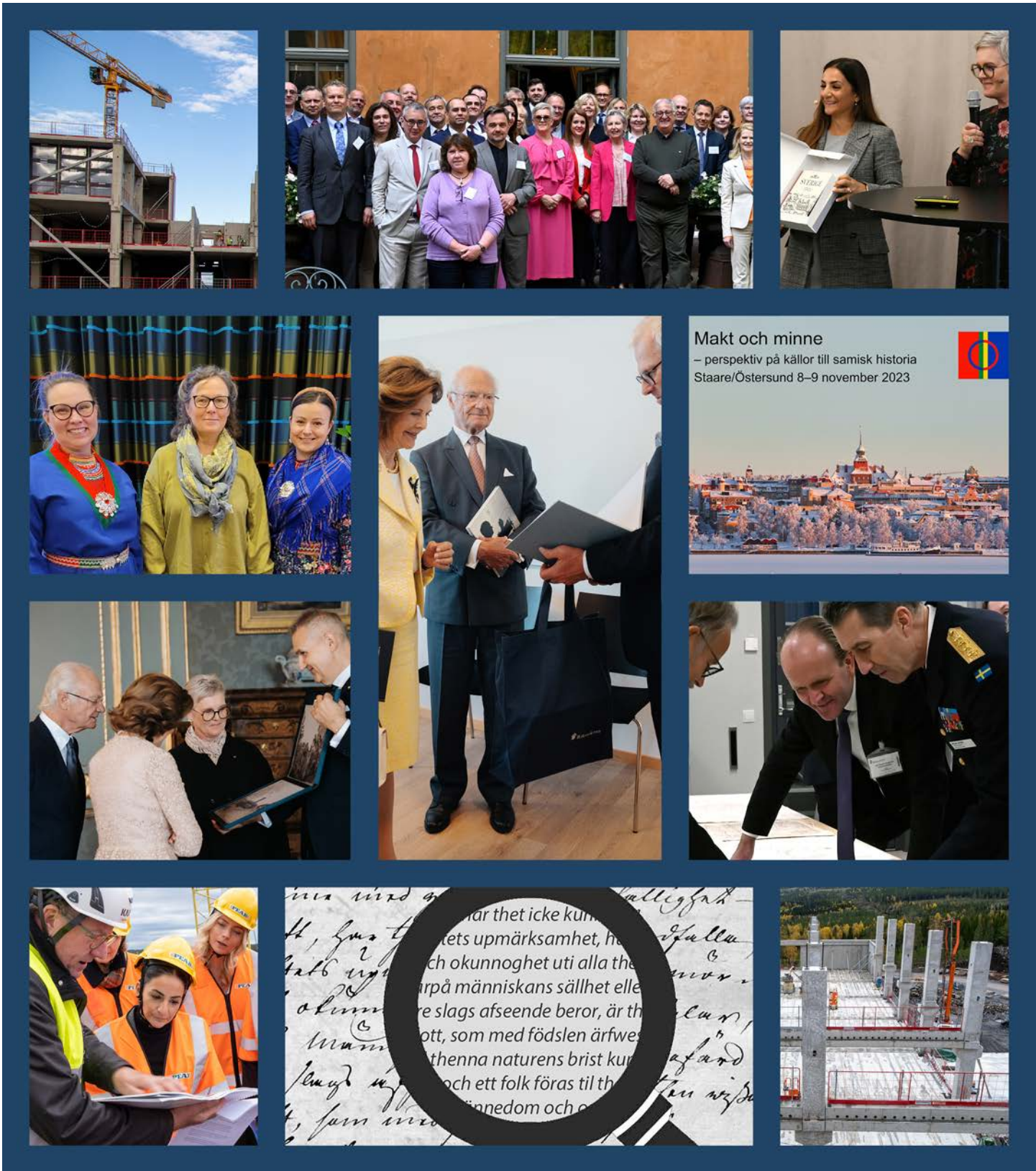
Makt och minne – perspektiv på källor till samisk historia Staare/Östersund 8–9 november 2023