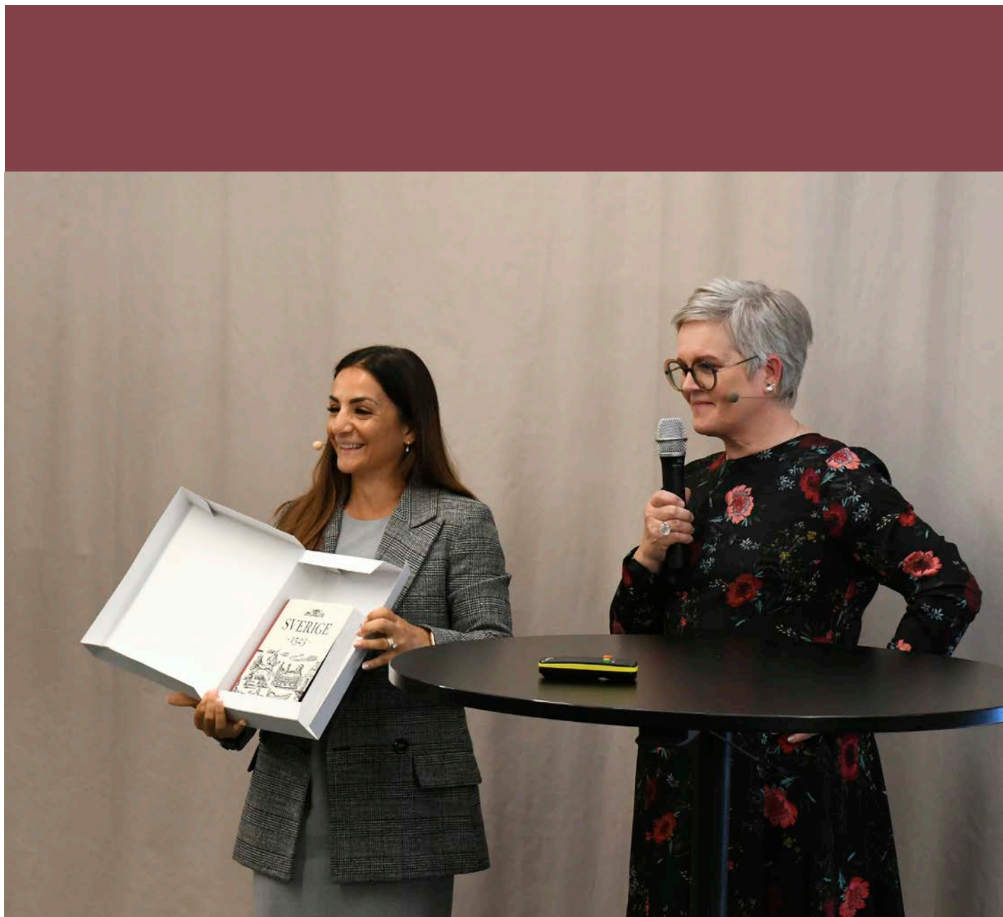
Kulturministern Parisa Liljestrand tar emot "Sverige 1523" vid boksläppet på Riksarkivet i Stockholm den 30 maj 2023.