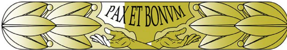
Doktorsring för teologie doktor vid Lunds universitet. Teckning: Davor Zovko, Riksarkivet.

Flera modellritningar till Lunds universitet har levererats, bland annat originalritningar till två doktorsringar, hattmärke samt rockslagsmärke för hedersledamöter.