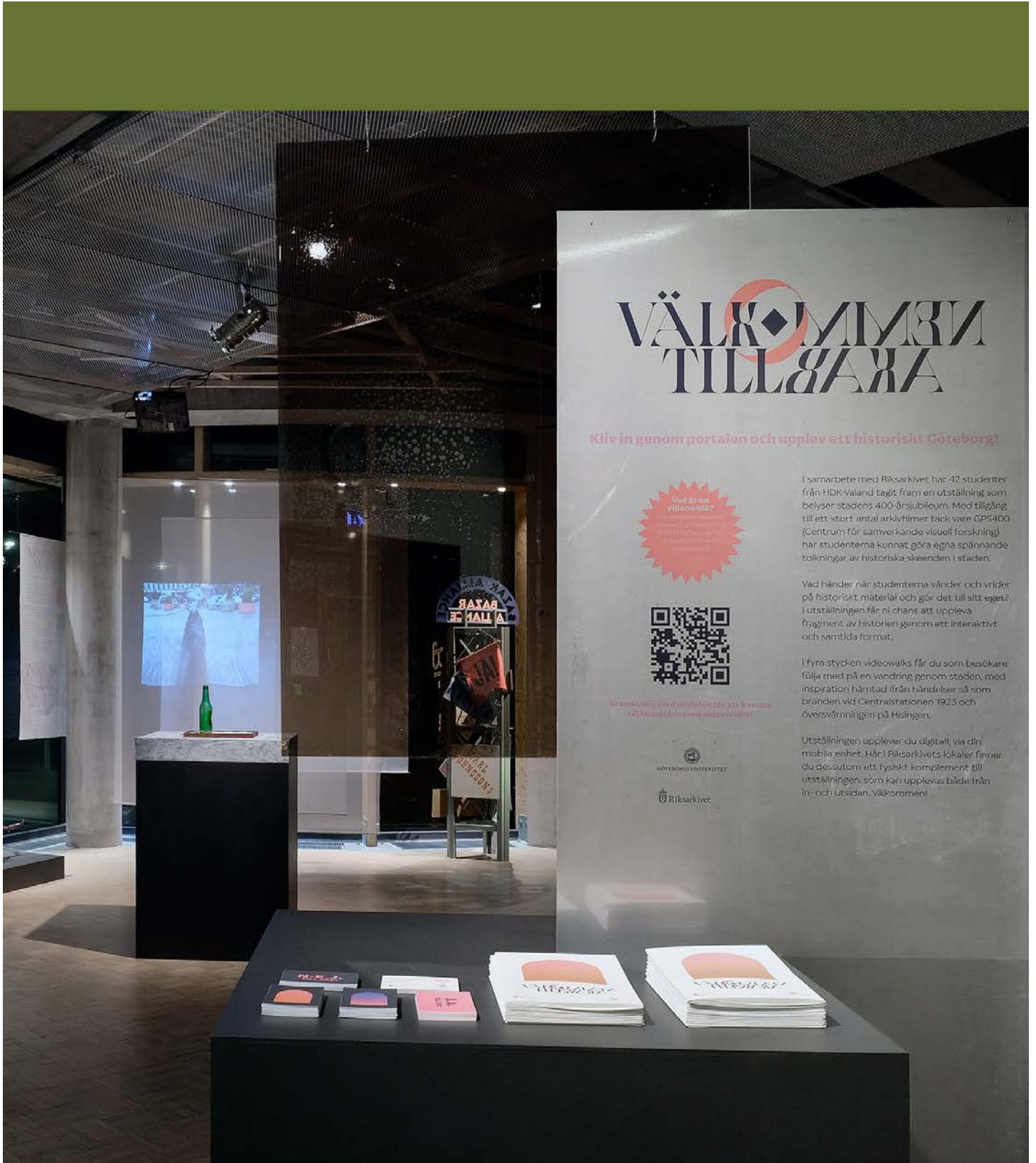
Staden Göteborg firade 400 år och detta uppmärksammades bland annat genom utställningen Välkommen tillbaka! – både digitalt och på plats i Riksarkivets lokaler. Utställningen producerades i samarbete med designstudenter från HDK-Valand.