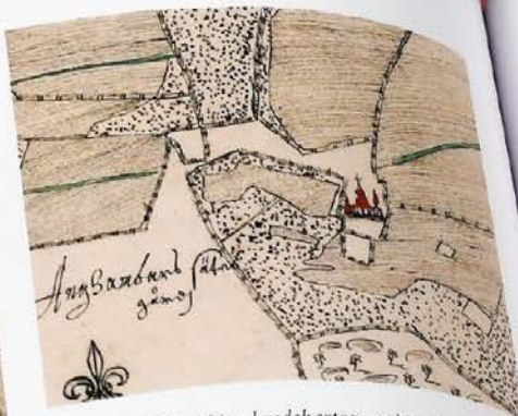
En av de äldsta Värmlandskartorna visar Aghnhammars säteri i Grums socken 1638. Åkern är indelad i fem lika stora gårdar vilket talar för femsäde. Kartan återfinns något ologiskt i jordeboken för Närke (S1:142-143).