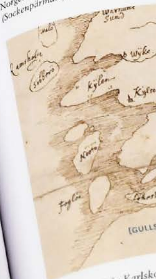
Vattenvägen från Karlskrona till Årå. Söder om Årå.

I Sveriges kartor och lantmätare 1628 till 1680. Från idé till tolv tusen kartor berättar Clas Tollin om den systematiska och storskaliga kartering av hela det dåvarande Sverige som skedde i och med inrättandet av det svenska lantmäteriet 1628. Boken är utgiven i samarbete med Kungl. Vitterhetsakademien.