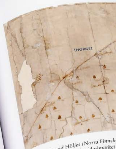
Klarälvsdalen vid Höljes (Norra Finske Norge). Gränsen vinklade vid rämärket (Sockenpärmar:78).