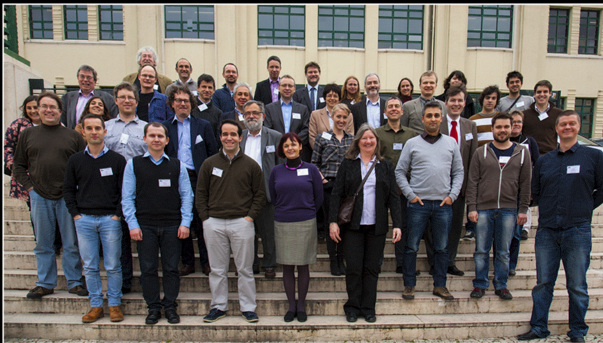
E-ARK Kickoff Meeting Lisbon February 2014